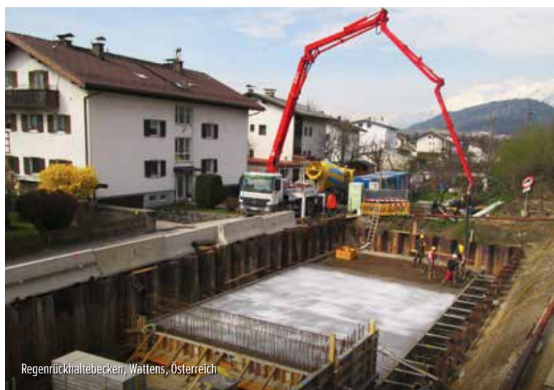
Regenrückhaltebecken, Wattens, Österreich