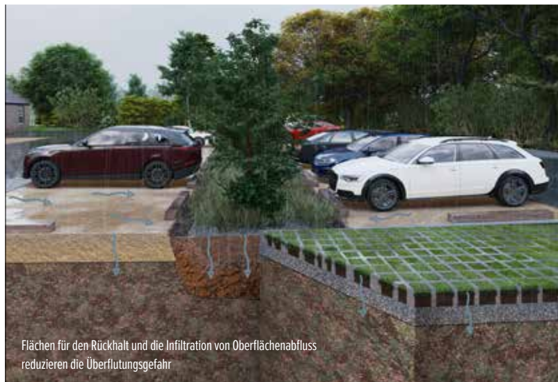
Flächen für den Rückhalt und die Infiltration von Oberflächenabfluss reduzieren die Überflutungsgefahr