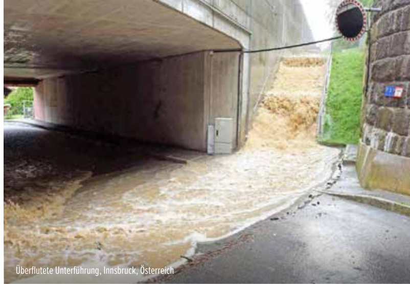
Überflutete Unterführung, Innsbruck, Österreich