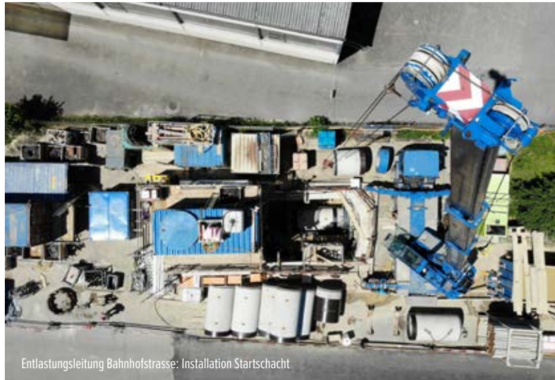
Entlastungsleitung Bahnhofstrasse: Installation Startschacht