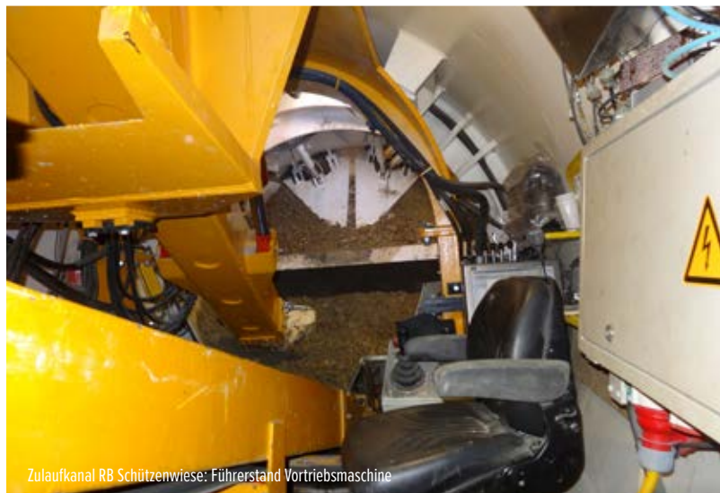
Zulaufkanal RB Schützenwiese: Führerstand Vortriebsmaschine