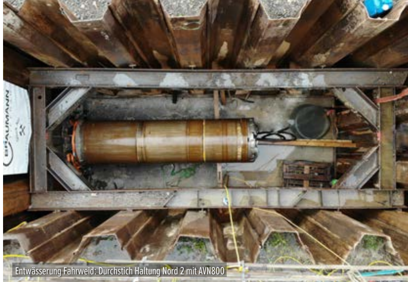
Entwässerung Fahrweid: Durchstich Haltung Nord 2 mit AVN800

Zum Gesamtpaket der Planung gehören nebst Vortriebsarbeiten auch die auf die spezifischen Projektanforderungen angepassten Baugrubensicherungen für die Start- und Zielschächte sowie die definitiven Schachtbauwerke.