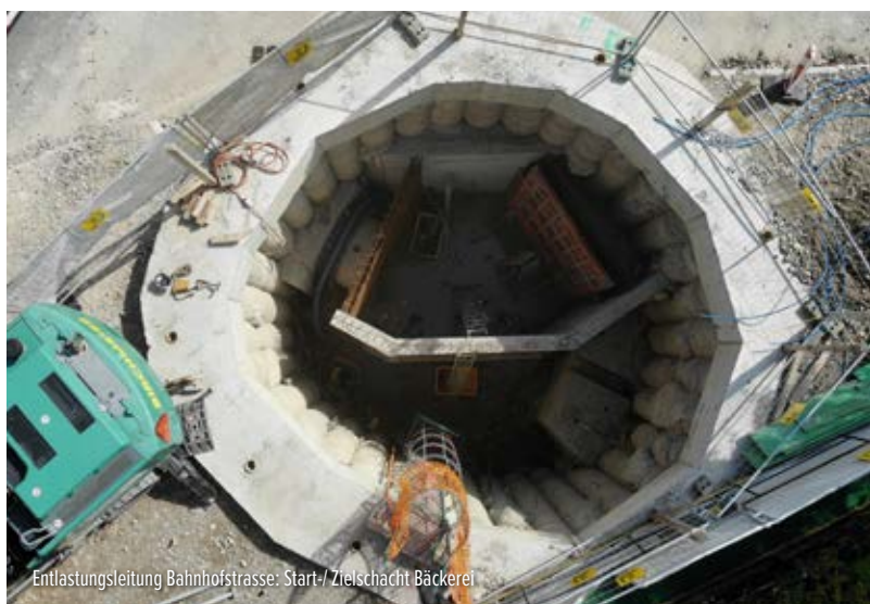
Entlastungsleitung Bahnhofstrasse: Start/ Zielschacht Bäckerei