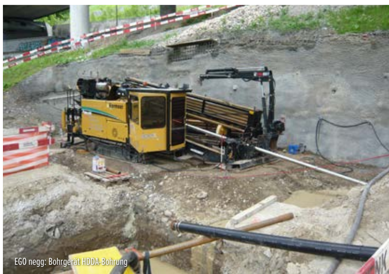
EGO negg: Bohrgerät HDDA-Bohrung