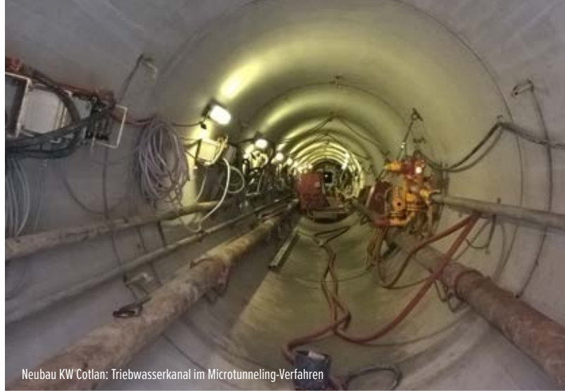
Neubau KW Cotlan: Triebwasserkanal im Microtunneling-Verfahren