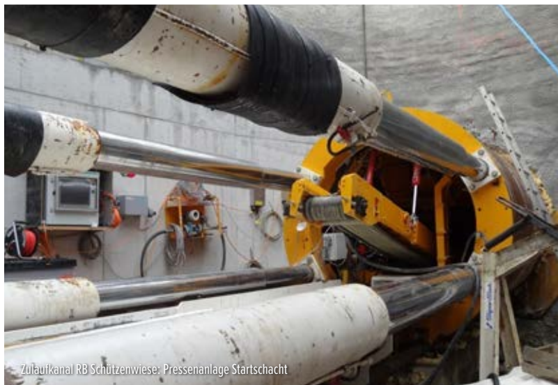
Zulaufkanal RB Schützenwiese: Pressenanlage Startschacht