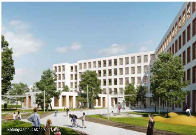
Bildungscampus Atzgersdorf, Wien