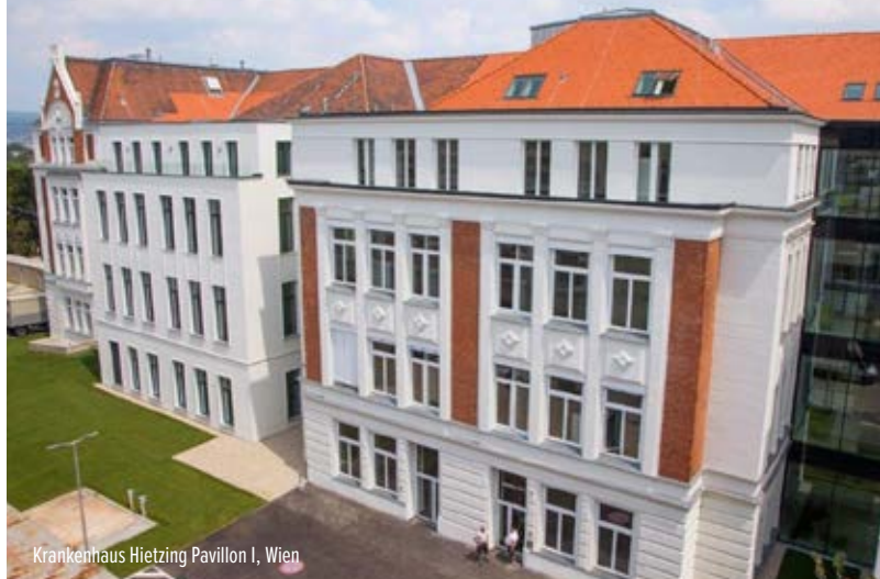
Krankenhaus Hietzing Pavillon I, Wien

Wir sehen Kreativität und Erfahrung als Garant für die erfolgreiche Umsetzung komplexer Projekte in denen Technik, Funktionalität, Nachhaltigkeit, Umwelt und Ästhetik die treibenden Grössen sind. Die Nutzung innovativer Technologien und Arbeitsmethoden ermöglicht es uns anspruchsvolle Projekte im Sinne des Kunden optimal umzusetzen.