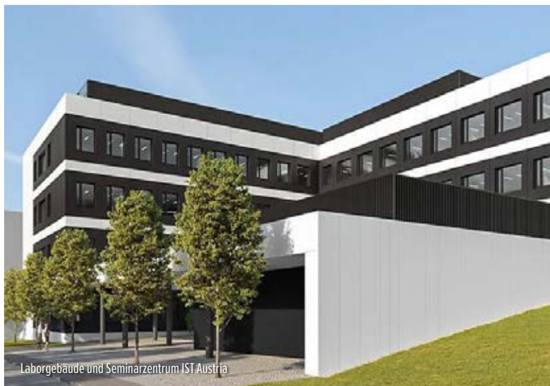
Laborgebäude und Seminarzentrum IST Austria