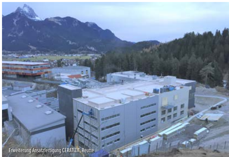
Erweiterung Ansatzfertigung CERATIZIT, Reutte