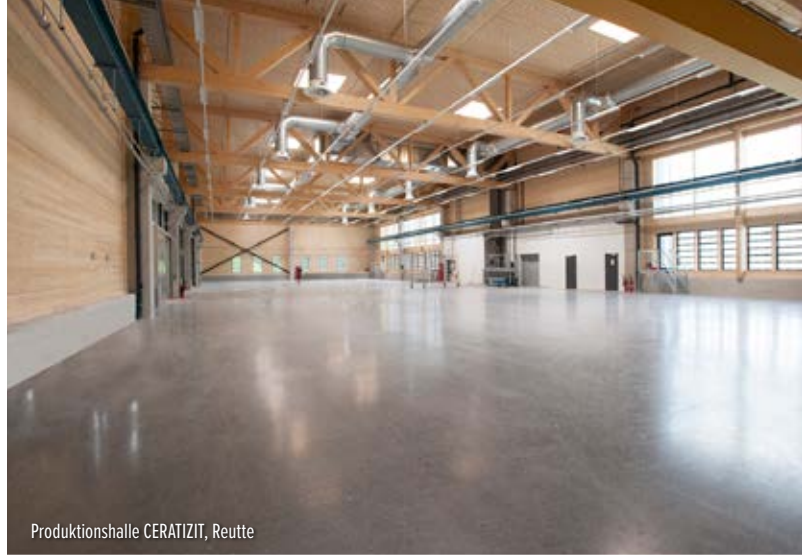
Produktionshalle CERATIZIT, Reutte