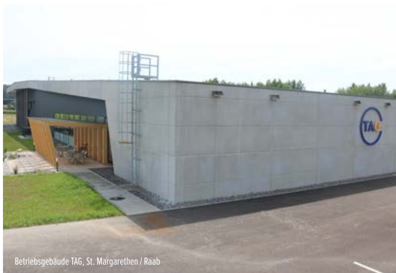
Betriebsgebäude TAG, St. Margarethen / Raab