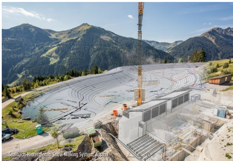
Saalbach-Hinterglemm Snow-Making System, Austria