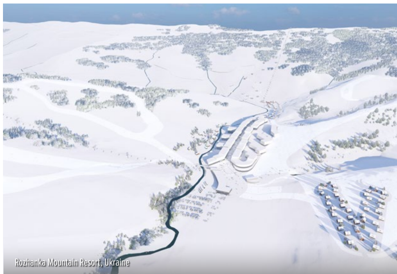
Rozhanka Mountain Resort, Ukraine